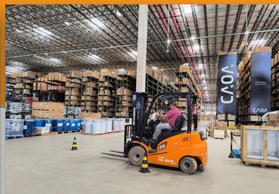
Treinamento NRs na Unidade de Franco da Rocha/SP