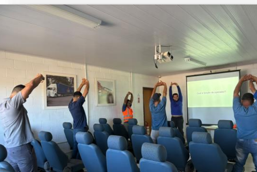
CIPA na Unidade de Anápolis/GO