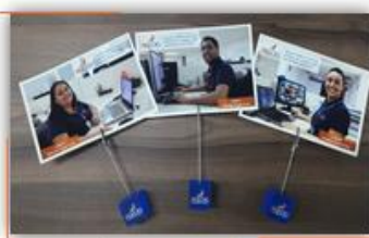
Boas Vindas em seu novo ambiente de trabalho.